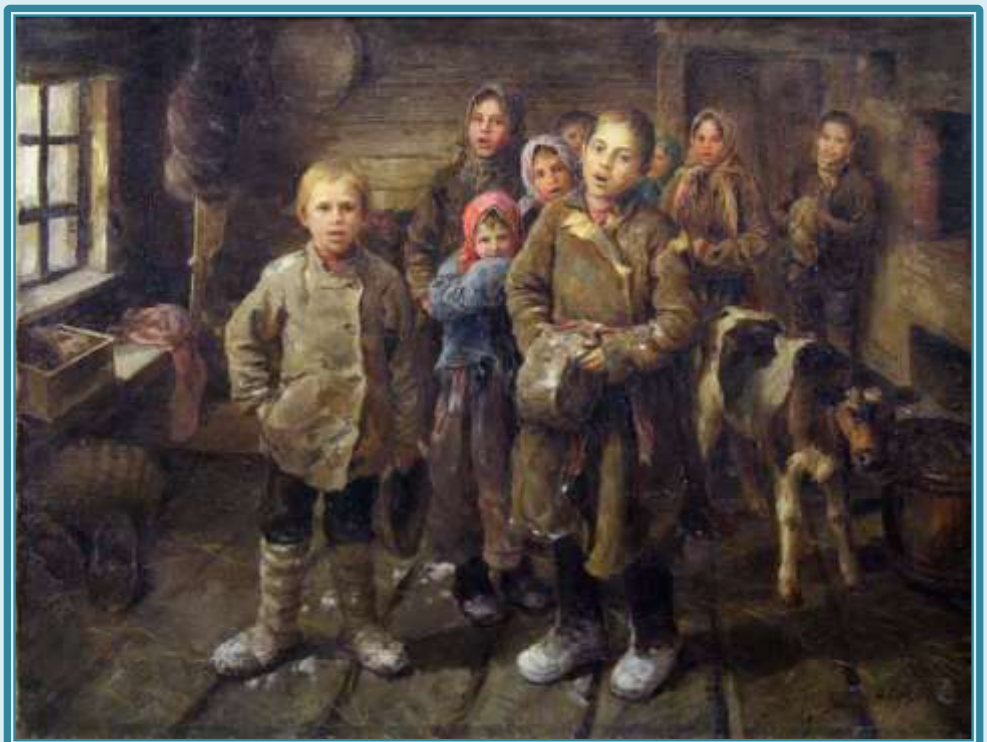
Ф.В. Сычков «Христославы»

Вечно будем Бога славить За такой день торжества! Разрешите Вас поздравить С Днем Христова Рождества! Много лета вам желаем, Много, много, много лет.